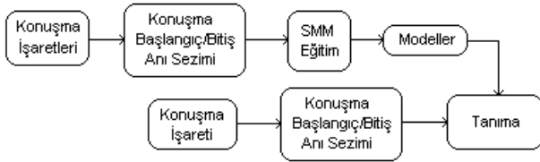
Şekil 1: Kullanılan konuşma tanıma sistemi.

Konuşma tanıma için sürekli dağılımlı SMM kullanılmıştır. Eğitim ve tanıma öncesi konuşma işaretlerinin başlangıç ve bitiş anlarının sezimi, enerji eşikleme tabanlı bir yöntemle gerçekleştirilmiştir. Akustik öznelikler Mel-Frekansı Kepstrum Katsayıları (MFKK), enerji ve seslilik olasılığı ile bunlara karşılık gelen fark ve ivme parametreleridir. Her konuşma tanıma görevi için geçerleme kümesi üzerinde en yüksek tanıma oranını veren parametreler kullanılmıştır. Her Markov durumundaki akustik öznelik vektörlerinin olasılık yoğunluk işlevi, eğitimde kullanılan konuşmacı sayısına bağlı sayıda Gauss dağılım bileşeni içeren bir Gauss Karışım Modeli (GKM)’yle modellenmiştir. Eğitim Baum-Welch algoritmasıyla gerçekleştirilmiş, tanıma için